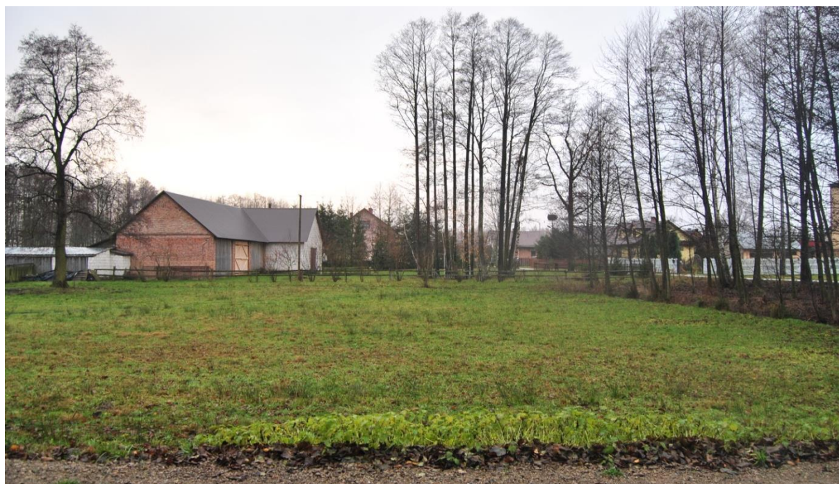
Rys. 2. Obszar objęty opracowaniem – południowy fragment terenu opracowania przy drodze gminnej Jarocin-Majdan Jarociński-Domostawa