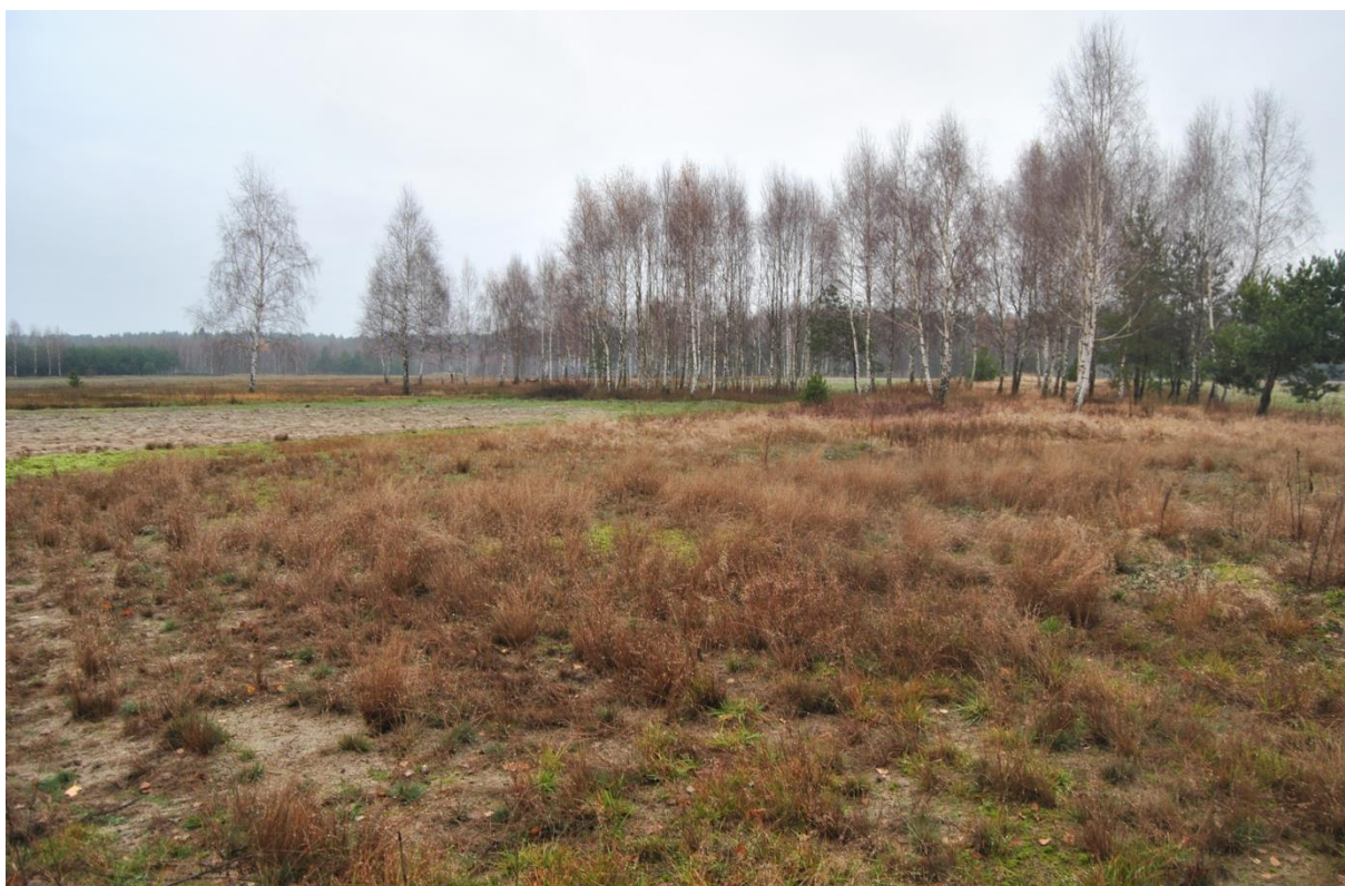
Rys. 3. Obszar objęty opracowaniem – fragment zachodni – niezabudowany