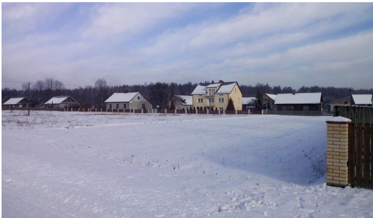
Rys. 4. Obszar objęty opracowaniem – widok fragment wschodni częściowo zabudowany